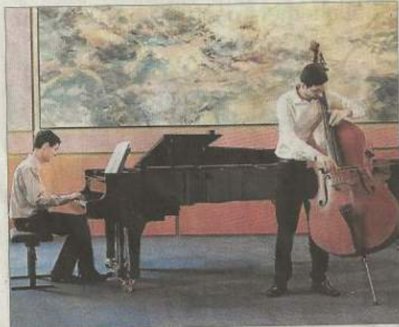
▶ Piano et contrebasse vont résonner dans l'écran de la chapelle St-Saturnin le samedi 28 mai à 17 heures.

Autour de cet instrument, le duo va interpréter des pièces originales et des transcriptions, alternant subtilement des œuvres de grands compositeurs (Mozart, Schubert, Saint-Saëns, Massenet...) et des pièces, moins